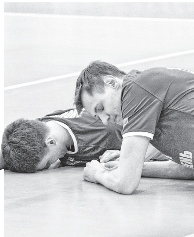
ВОЛЕЙБОЛ. ЧЕМПИОНАТ РОССИИ. МУЖЧИНЫ. ВЫСШАЯ ЛИГА «А». ИТОГОВОЕ ПОЛОЖЕНИЕ