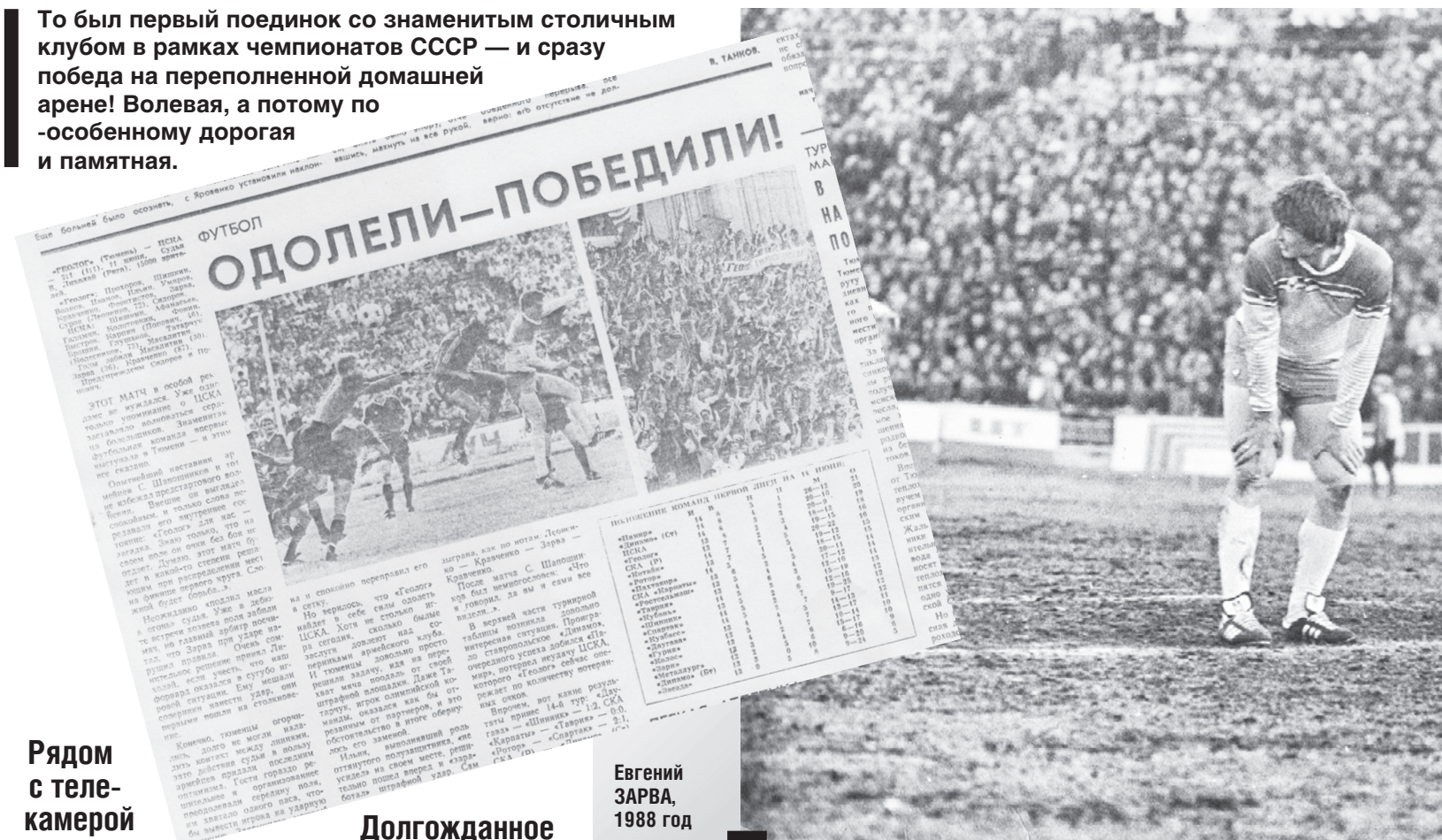
Рядом с телекамерой

То был первый поединок со знаменитым столичным клубом в рамках чемпионатов СССР — и сразу победа на переполненной домашней арене! Волевая, а потому по-особенному дорогая и памятная.